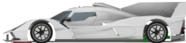
Lamborghini SC-63 LMdH