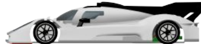
G-99 Fantasy Hypercar