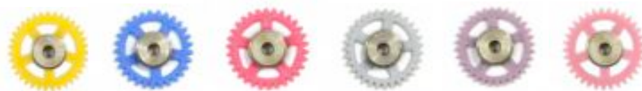
SC-1159r (28z) SC-1160r (29z) SC-1161r (30z) SC-1162r (31z) SC-1163r (32z) SC-1164r (33z)

8.1 Las coronas homologadas para bancada RT4 deben ser de la gama de 16.5mm de Scaleauto (insert aluminio en color dorado). Ref. Sc-1159R a SC-1164R